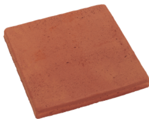
RT 12 Rød renfarget