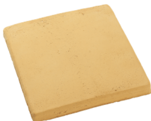
RT 10 Gul renfarget

For å unngå at f. eks. fett osv. trekker ned i flisene, fjernes vannet hurtig fra flisene igjen - eventuelt med en våtstøvsuger. Deretter benyttes igjen rengjørings- og pleiemidler til steingulv for å "lukke" overflaten.